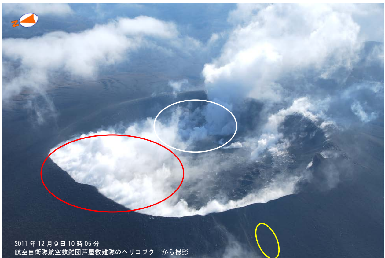
図1 霧島山（新燃岳） 火口内の状況