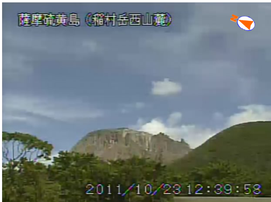
図 1 薩摩硫黄島 硫黄岳の噴煙の状況（10 月 23 日、稲村岳西山麓遠望カメラによる）

この火山活動解説資料は福岡管区気象台ホームページ ( http://www.jma-net.go.jp/fukuoka/ ) や気象庁ホームページ ( http://www.seisvol.kishou.go.jp/tokyo/volcano.html ) でも閲覧することができます。次回の火山活動解説資料（平成 23 年 11 月分）は平成 23 年 12 月 8 日に発表する予定です。資料中の地図の作成に当たっては、国土地理院長の承認を得て、同院発行の『数値地図 10m メッシュ（火山標高）』を使用しています（承認番号：平 20 業使、第 385 号）。