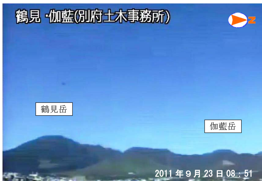
図 1 鶴見岳・伽藍岳 噴気などの状況（9 月 23 日、鶴見岳監視カメラ（大分県）による） 噴気は認められませんでした。

この火山活動解説資料は福岡管区気象台ホームページ（ http://www.jma-net.go.jp/fukuoka/ ）や気象庁ホームページ（ http://www.seisvol.kishou.go.jp/tokyo/volcano.html ）でも閲覧することができます。次回の火山活動解説資料（平成 23 年 10 月分）は平成 23 年 11 月 9 日に発表する予定です。