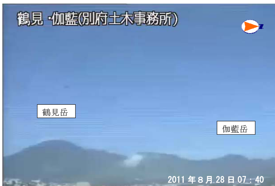
図 1 鶴見岳・伽藍岳 噴気などの状況（8月28日、鶴見岳監視カメラ（大分県）による） 噴気は認められませんでした。

この火山活動解説資料は福岡管区气象台ホームページ（ http://www.jma-net.go.jp/fukuoka/ ）や気象庁ホームページ（ http://www.seisvol.kishou.go.jp/tokyo/volcano.html ）でも閲覧することができます。次回の火山活動解説資料（平成 23 年 9 月分）は平成 23 年 10 月 6 日に発表する予定です。