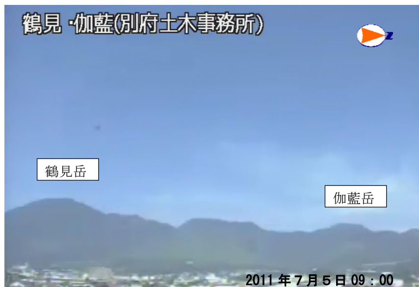
図 1 鶴見岳・伽藍岳 遠望観測の状況（7 月 5 日、鶴見岳監視カメラ（大分県）による）

この火山活動解説資料は福岡管区气象台ホームページ（ http://www.jma-net.go.jp/fukuoka/ ）や気象庁ホームページ（ http://www.seisvol.kishou.go.jp/tokyo/volcano.html ）でも閲覧することができます。次回の火山活動解説資料（平成 23 年 8 月分）は平成 23 年 9 月 8 日に発表する予定です。