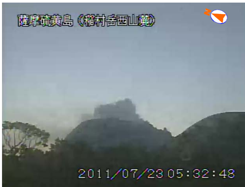
図 1 薩摩硫黄島 噴煙の状況（7 月 23 日、稲村岳西山麓遠望カメラによる）

この火山活動解説資料は福岡管区气象台ホームページ ( http://www.jma-net.go.jp/fukuoka/ ) や気象庁ホームページ ( http://www.seisvol.kishou.go.jp/tokyo/volcano.html ) でも閲覧することができます。次回の火山活動解説資料（平成 23 年 8 月分）は平成 23 年 9 月 8 日に発表する予定です。