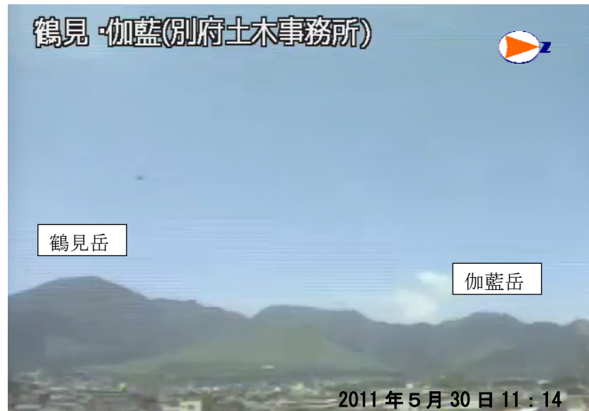
図 1 鶴見岳・伽藍岳 遠望観測の状況（5 月 30 日、鶴見岳監視カメラ（大分県）による）

この火山活動解説資料は福岡管区气象台ホームページ（ http://www.jma-net.go.jp/fukuoka/ ）や気象庁ホームページ（ http://www.seisvol.kishou.go.jp/tokyo/volcano.html ）でも閲覧することができます。次回の火山活動解説資料（平成 23 年 6 月分）は平成 23 年 7 月 8 日に発表する予定です。