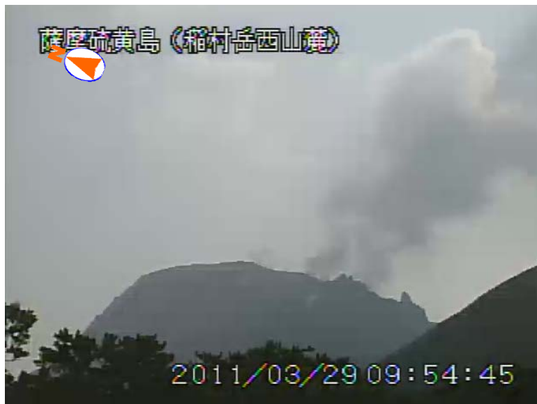
図 1 薩摩硫黄島 噴煙の状況（3 月 29 日、稲村岳西山麓遠望カメラによる）

この火山活動解説資料は福岡管区气象台ホームページ ( http://www.jma-net.go.jp/fukuoka/ ) や気象庁ホームページ ( http://www.seisvol.kishou.go.jp/tokyo/volcano.html ) でも閲覧することができます。次回の火山活動解説資料（平成 23 年 4 月分）は平成 23 年 5 月 10 日に発表する予定です。資料中の地図の作成に当たっては、国土地理院長の承認を得て、同院発行の『数値地図 10m メッシュ（火山標高）』を使用しています（承認番号：平 20 業使、第 385 号）。