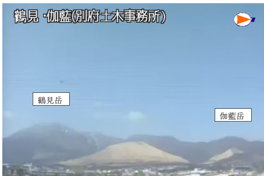
図 1 鶴見岳・伽藍岳 遠望観測の状況（2 月 21 日 10 時 14 分、鶴見岳監視カメラ（大分県）による）

この火山活動解説資料は福岡管区気象台ホームページ（ http://www.jma-net.go.jp/fukuoka/ ）や気象庁ホームページ（ http://www.seisvol.kishou.go.jp/tokyo/volcano.html ）でも閲覧することができます。次回の火山活動解説資料（平成 23 年 3 月分）は平成 23 年 4 月 8 日に発表する予定です。