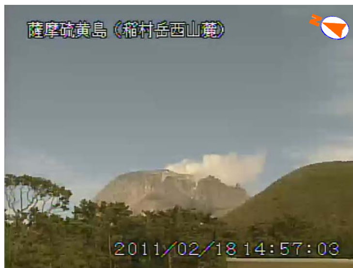
図 1 薩摩硫黄島 噴煙の状況（2 月 18 日、稲村岳西山麓遠望カメラによる）

振幅が小さく継続時間の短い火山性微動を 1 回観測しました。火山性微動の観測は 2010 年 2 月以来です。