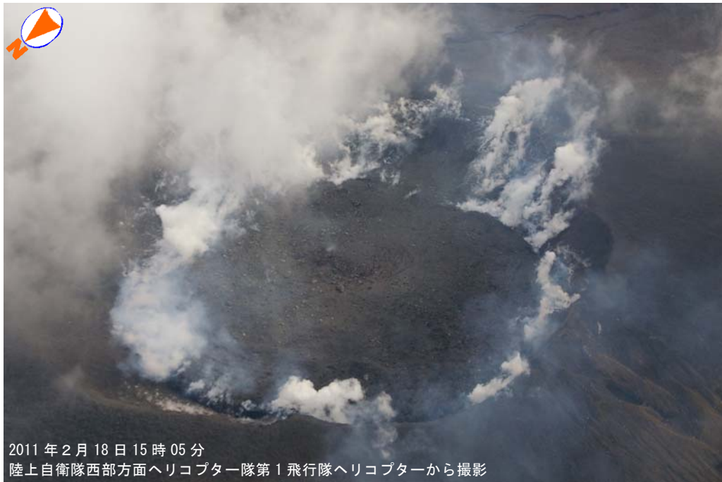
図 1 霧島山（新燃岳） 火口内の状況