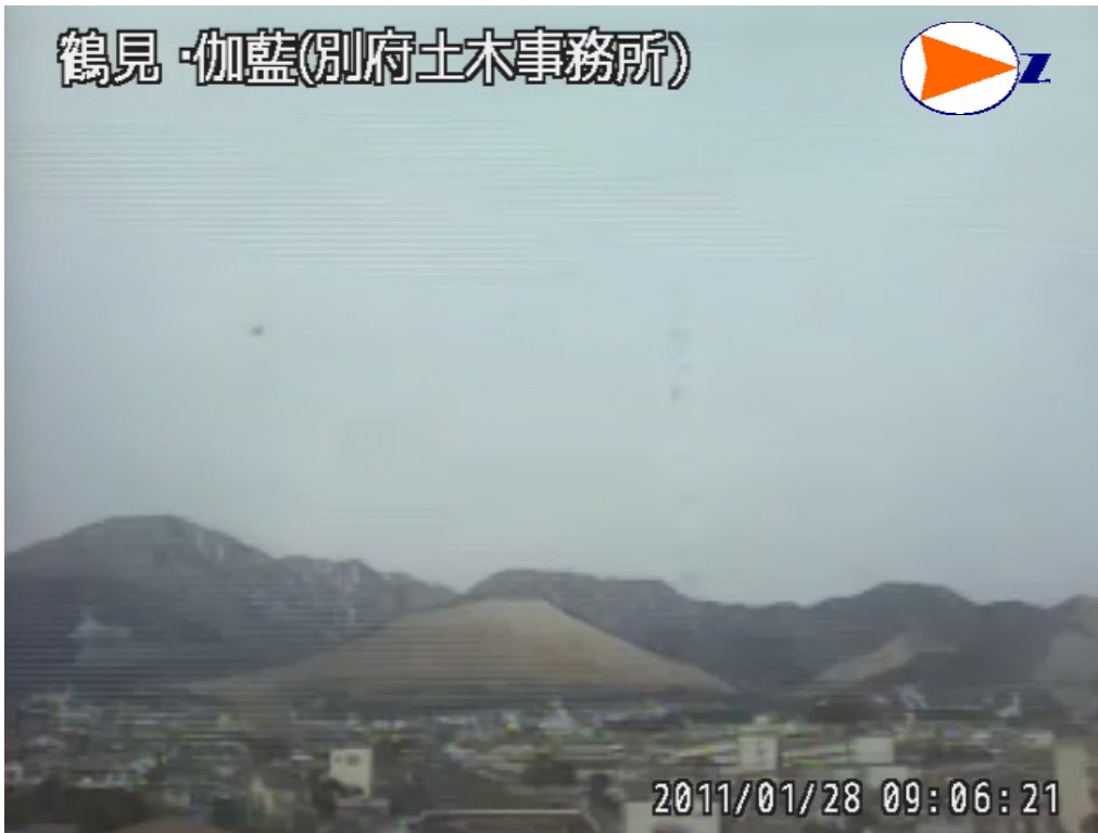
図 2 鶴見岳・伽藍岳 噴気の状態（1月28日、鶴見岳監視カメラ（大分県）による） 噴気は観測されませんでした。