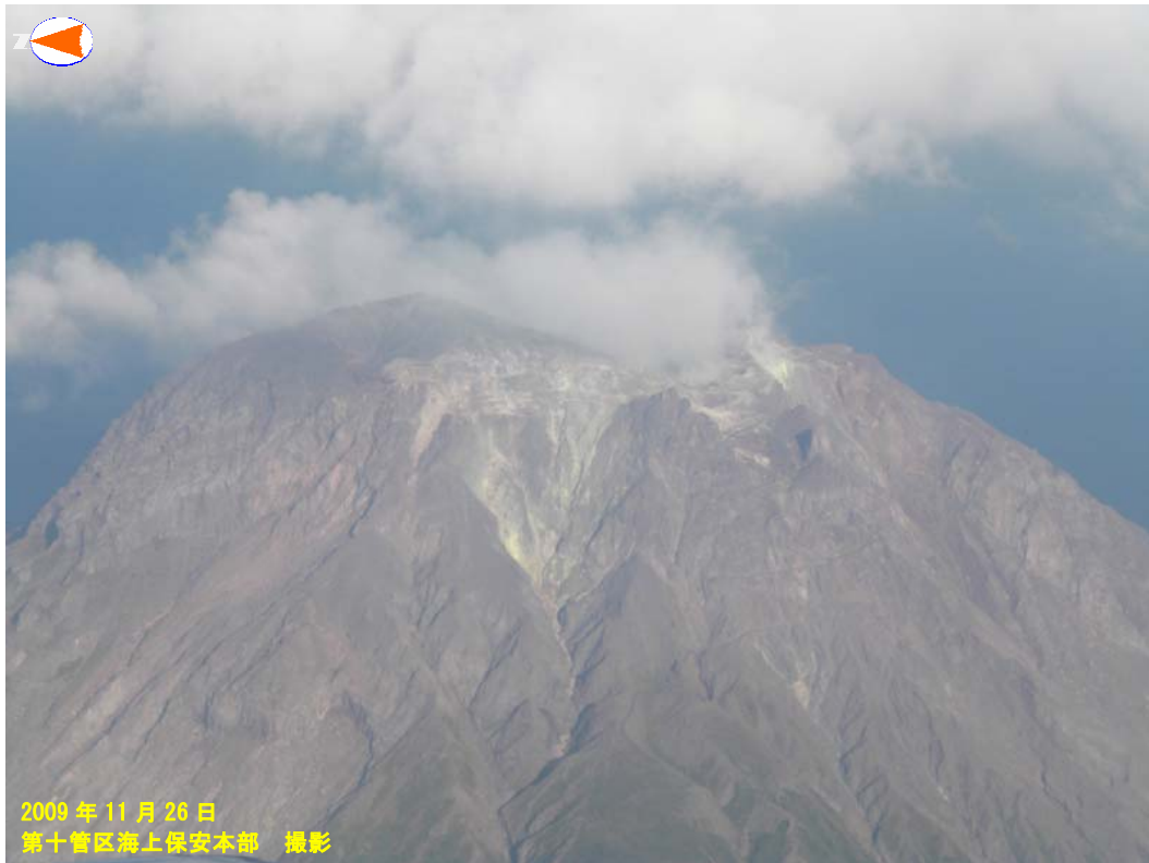
図 3※ 薩摩硫黄島 上空からの観測（西側上空から撮影）

26日に第十管区海上保安本部が行った上空からの観測では、硫黄岳山頂火口及びその周辺の状況に大きな変化はなく、硫黄岳山頂火口から白色の噴煙が上がっているのが確認されました。