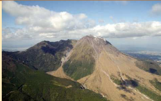
雲仙岳 南東側上空から撮影 九州地方整備局の協力による

噴火警戒レベルとは、噴火時などに危険な範囲や必要な防災対応を、レベル1から5の5段階に区分したものです。各レベルには、火山の周辺住民、観光客、登山者等のとるべき防災行動が一目で分かるキーワードを設定しています（レベル5は「避難」、レベル4は「避難準備」、レベル3は「入山規制」、レベル2は「火口周辺規制」、レベル1は「活火山であることに留意」）。対象となる火山が噴火警戒レベルのどの段階にあるかは、噴火警報等でお伝えします。