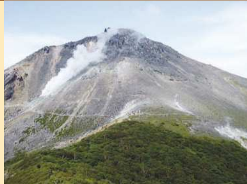
那須岳の火山活動について 1408年から1410年の活動時に、火砕流が発生し、さらに茶臼岳溶岩ドームが形成されました。この噴火で180余名が犠牲になりました。

噴火警戒レベルとは、噴火時などに危険な範囲や必要な防災対応を、レベル1から5の5段階に区分したものです。各レベルには、火山の周辺住民、観光客、登山者等のとるべき防災行動が一目で分かるキーワードを設定しています（レベル5は「避難」、レベル4は「避難準備」、レベル3は「入山規制」、レベル2は「火口周辺規制」、レベル1は「活火山であることに留意」）。対象となる火山が噴火警戒レベルのどの段階にあるかは、噴火警報等でお伝えします。