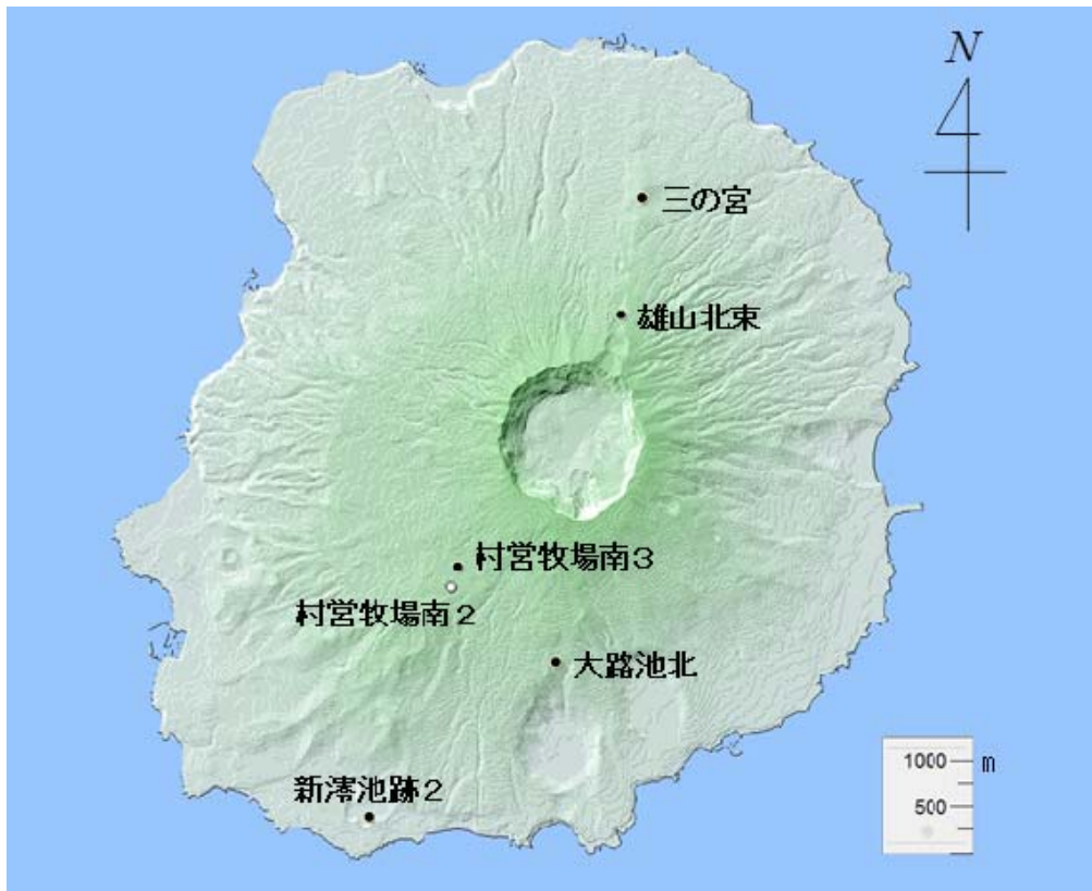
第1図 全磁力観測点配置図 (●: 気象庁、○: 気象庁 (観測終了))

地磁気全磁力変化からは年周変化・黒潮等の影響が見られるが、期間中変化傾向に変わりは見られず、特段有意な変化は観測されなかった。