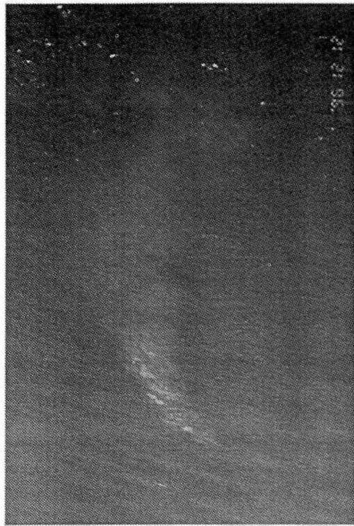
写真1 福徳岡ノ場の変色水

Photo.1 Discolored water from Hukutoku-Oka-no-Ba volcano on Dec. 12, 1996