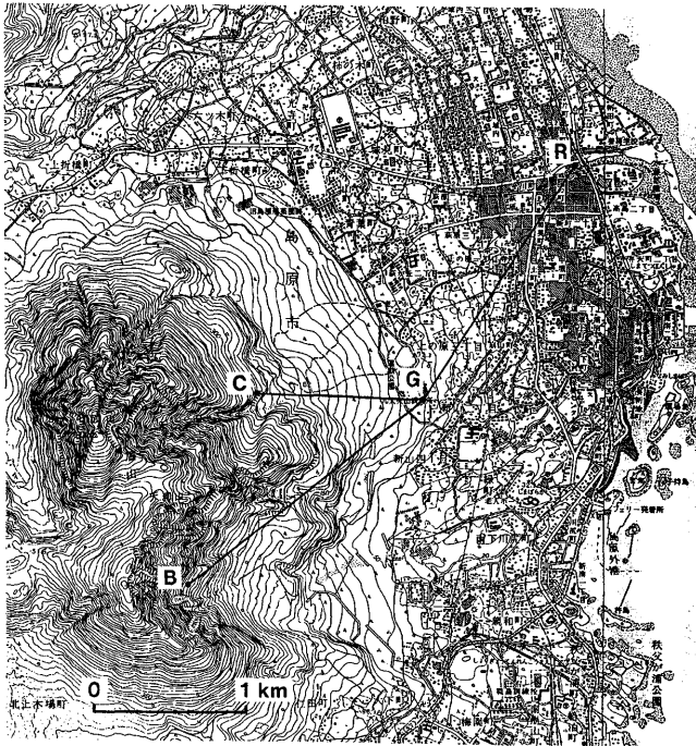
第1図 眉山東斜面の光波測距観測網 Fig.1 EDM network around Mayu-yama.

観測結果を第2図に示す。図に明らかなように、各測線の斜距離にはいずれも測定誤差を越える大きな変化はないものと判断される。なおG-A間の測定は現在行っていない。