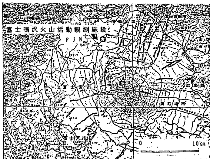
第1図 富士鳴沢火山活動観測施設（FJN）の位置

防災科学研究所の富士鳴沢火山活動観測施設（第1図）では、1992年12月8日07時から09時にかけて、1～数分間継続する振動を数回観測した。第2図に短周期地震計の記象を示す。この振動は、富士山北斜面で発生した降雨による雪崩によって励起されたものと考えられる。12月7日から8日にかけての傾斜変動と降雨量の記録を第3図に示す。振動が観測される前10時間に約100mmの降雨量があった。傾斜には目立った変化は見られない。（鶴川元雄）