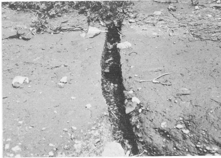
第3図 C地点(第2図)の地割れ。割れ目の巾は約10cmで、約3cmの段差がある。