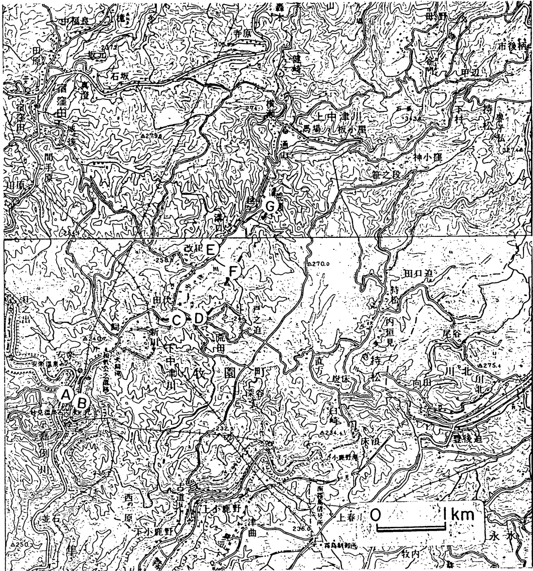
第2図 中津川地震の現地調査。A. 石垣くずれ。 B. がけくずれ。C D H G . 一連の地割れ。