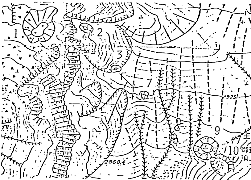
図1. 御岳山頂火孔群

なお気象庁地震課でも今期たびたび現地調査をくりかえされ、その観測結果と貴重な採取試料を我々に提供された。