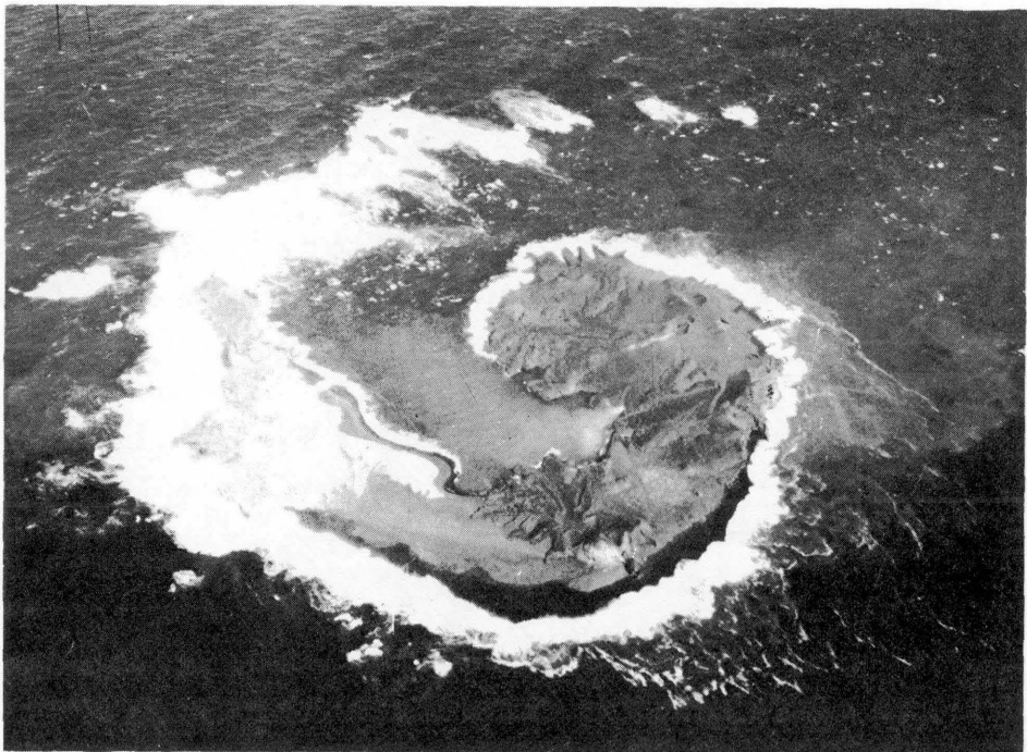
第1図 昭和49年11月19日海上自衛隊機が撮影した西之島火山