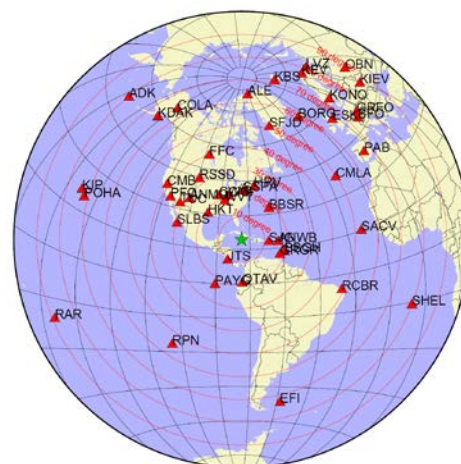
解析に使用した観測点配置

また、解析には金森博士及び Rivera 博士に頂いたプログラムを使用した。記して感謝する。