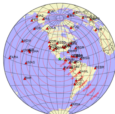
解析に使用した観測点配置

また、解析には金森博士及び Rivera 博士に頂いたプログラムを使用した。記して感謝する。