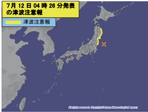
図 4-1 7 月 12 日の福島県沖の地震による津波に対して発表した津波注意報（×印は震央を示す）

今回の地震により、気象庁は 7 月 12 日 04 時 26 分に岩手県、宮城県、福島県の沿岸に対して、津波注意報を発表した（同日 06 時 15 分に全て解除）。今回の地震に伴い、宮城県の石巻市鮎川で 17cm、福島県の相馬で 15cm など、岩手県、宮城県及び福島県の沿岸で津波を観測した。