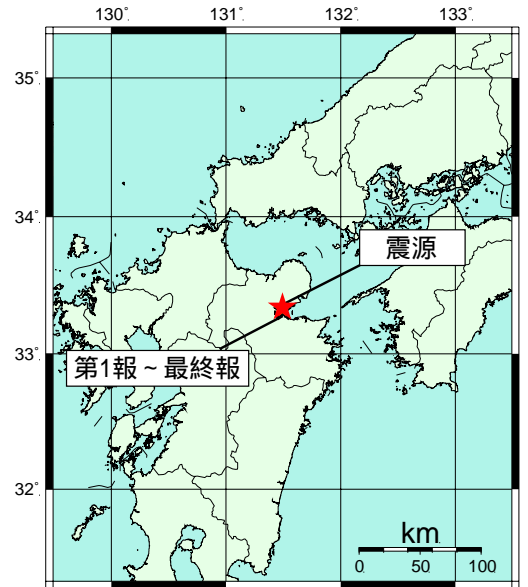
図: 推定した震源の位置