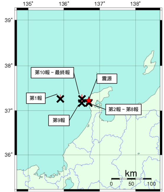
図: 推定した震源の位置