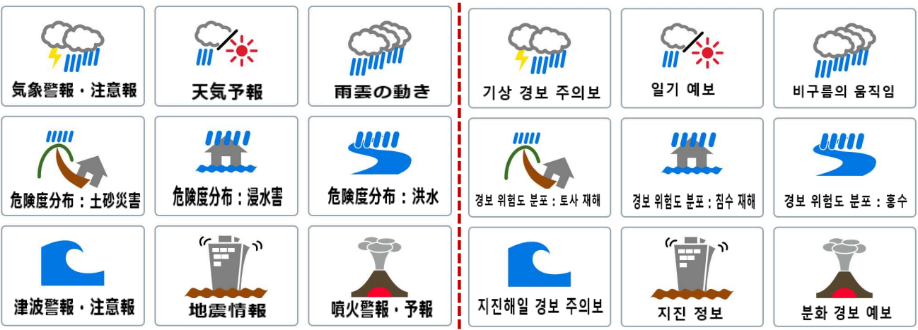
図2 多言語での情報ページ(左：日本語での例、右：韓国語での例) https://www.jma.go.jp/jma/kokusai/multi.html 多言語辞書のページ https://www.data.jma.go.jp/developer/multilingual.html

気象庁では引き続き、外国人の方の気象災害による被害の防止・軽減に繋がるよう、情報の利用拡大に取り組めます。