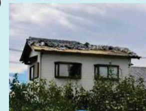
突風被害例 (住家の屋根瓦の飛散)