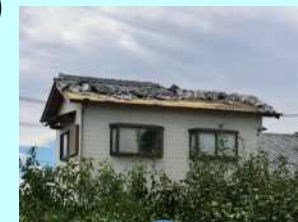
突風被害例 (住家の屋根瓦の飛散)