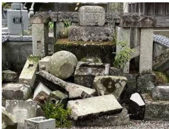
写真1 石灯籠の倒壊 (宿毛市桜町)