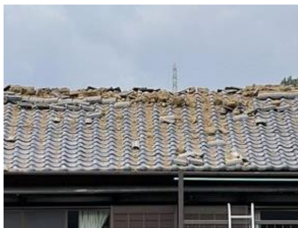
写真2 屋根瓦の落下 (宿毛市桜町)