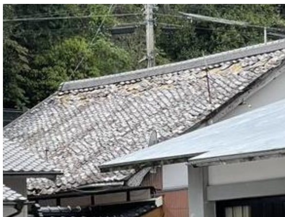
写真3 屋根瓦のずれ (宿毛市桜町)